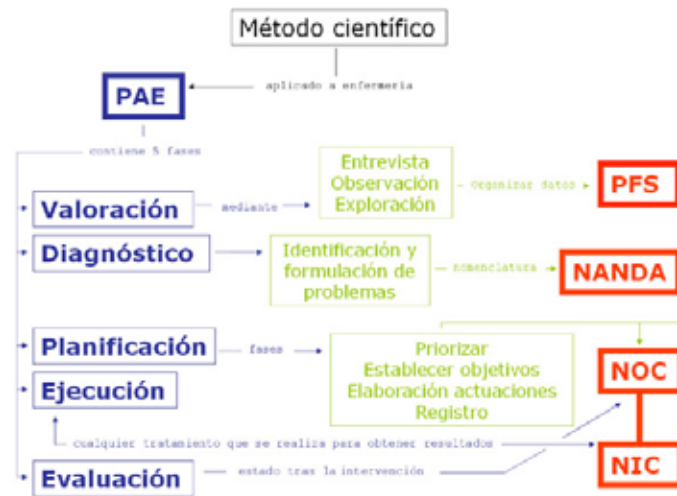
Figura 4. Ejemplo de mapa conceptual