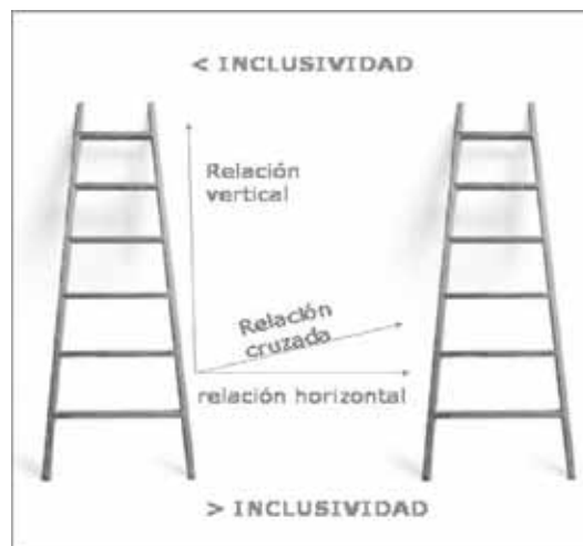
Figura 2. Relaciones por nivel de inclusividad

Las proposiciones representan la unión de dos o más conceptos relacionados entre sí mediante una palabra de enlace. Inicialmente debemos de hacerlo de forma intuitiva, incluso estableciendo más de una relación entre dos mismos conceptos (podemos utilizar verbos, preposiciones, conjunciones, adverbios) (Figura 1). Use líneas que conecten los conceptos y escriba sobre una de ellas una palabra o enunciado que aclare por qué los conceptos están conectados entre sí. Hay que establecer todas las relaciones posibles entre todos los conceptos, aunque en nuestro mapa definitivo desechemos algunas; así, estableceremos relaciones horizontales (mismo nivel de inclusividad) (Figura 2), verticales (relación jerárquica) y cruzadas (distinto nivel de inclusividad). Las conexiones son muy importantes en nuestro mapa conceptual y deben de aportar información clave para el entendimiento del mapa (pensemos que sin ellos el mapa no tiene sentido).